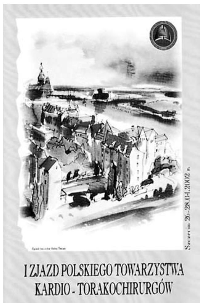
Ryc. 1. Strona tytułowa programu I Zjazdu Polskiego Towarzystwa Kardio-Torakochirurgów