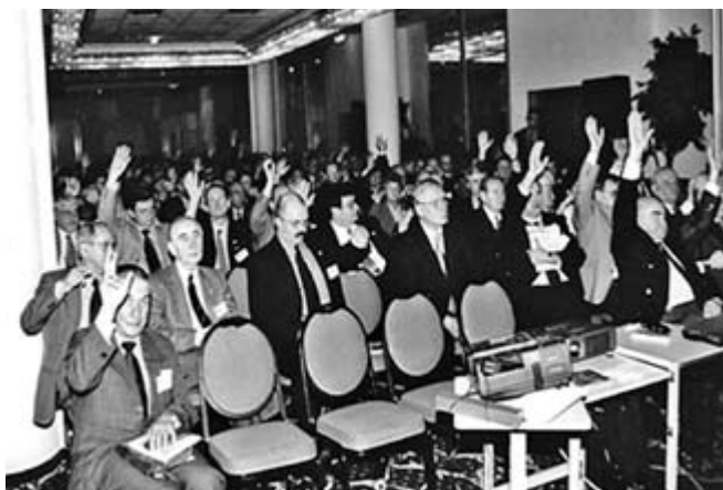
Ryc. 2. Zebranie założycielskie i Walne Zgromadzenie Członków Polskiego Towarzystwa Kardio-Torakochirurgów. Wybór Zarządu nowo powołanego Polskiego Towarzystwa Kardio-Torakochirurgów

Fig. 2. Meeting of founders and general assembly of members of the Polish Society of Cardiothoracic Surgeons. Elections to the board of the newly founded Polish Society of Cardiothoracic Surgeons